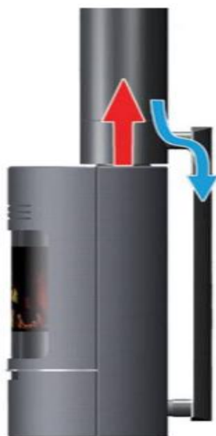
Figur 3 Tilluftsør med tilfutskanal