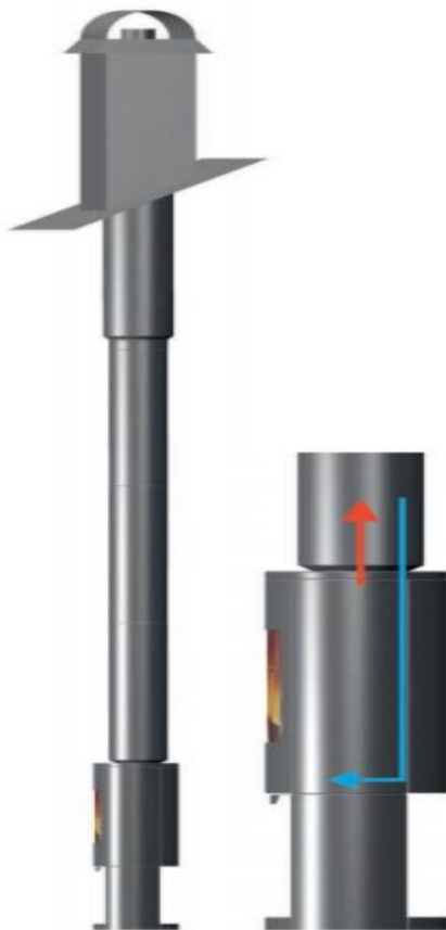
Figur 2 Tilluftsør med kobling rett i toppen

men da vil man måtte montere et lufferør på baksiden av ovnen (Se figur 2). Hvilken pipeleverandør som benyttes avgjøres av styret etter ekstraordinær generalforsamling.